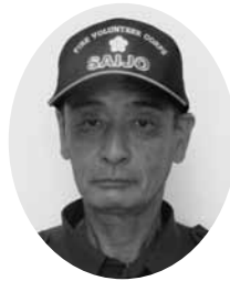
西条市消防団 副団長