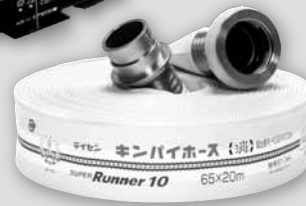
キンバイスーパースランナーホース