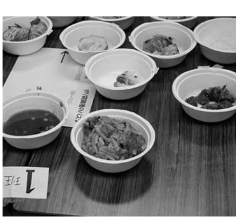
女性消防団の方たちと一緒に作った非常食