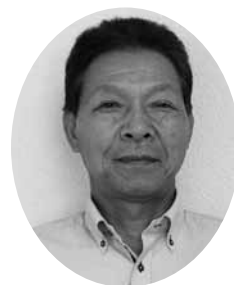
大洲市自主防災組織連絡協議会