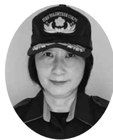
四国中央市消防団