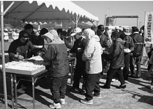
自主防災組織と合同の炊き出し訓練

昼間島を留守にする男性団員の代わりに、万が一の火災に備えて、消防団と合同での機械器具点検、消火栓の操作方