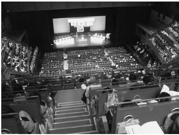
二千数百名を埋め尽くした会場