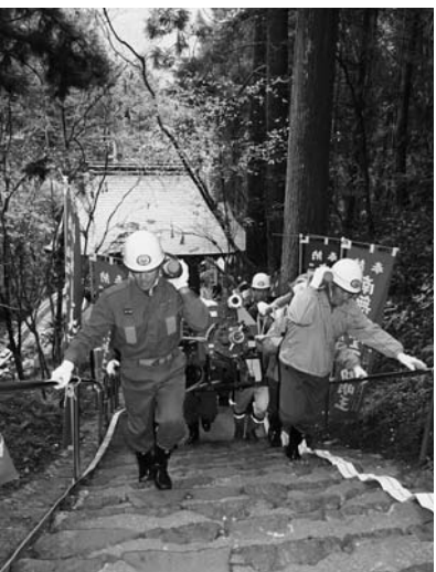
ポンプを担ぎ上げる団員