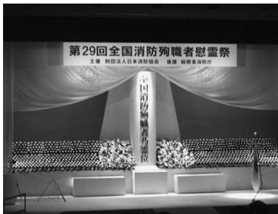
慰霊祭会場のステージ