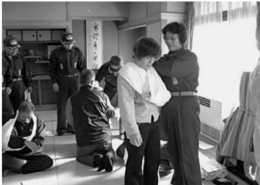
地域住民に応急手当の指導

消防団員としてはまだまだ新人ですが、佐島婦人協力隊には長い歴史があり、昭和三十九年に発足以来、隊員十八名で四十六年間活動してきま