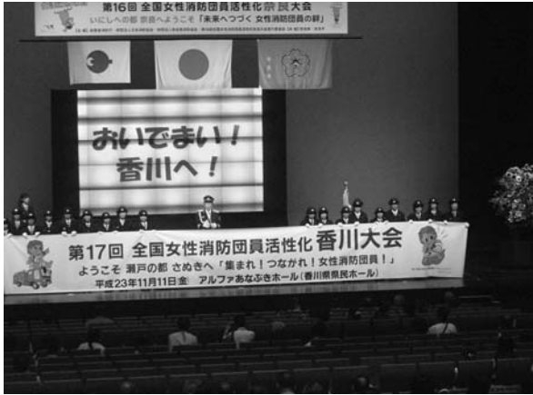
次回開催地の香川県への引き継ぎ