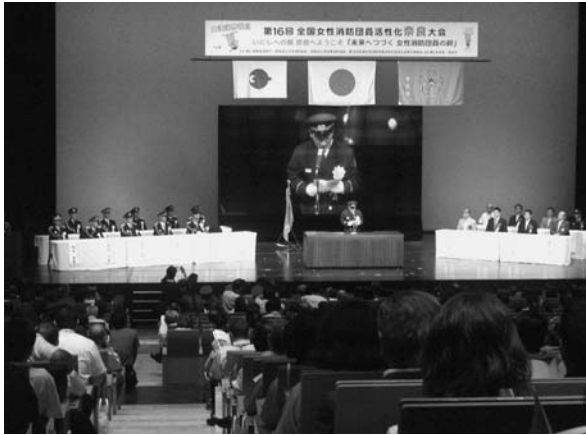
高木会長あいさつ