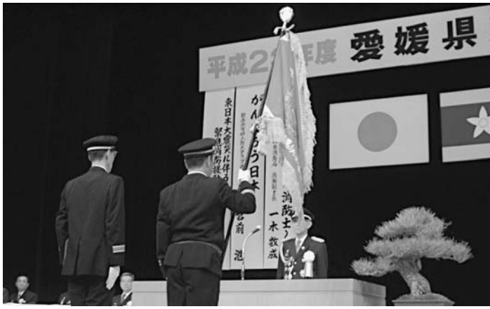
愛媛県消防協会長 表彰