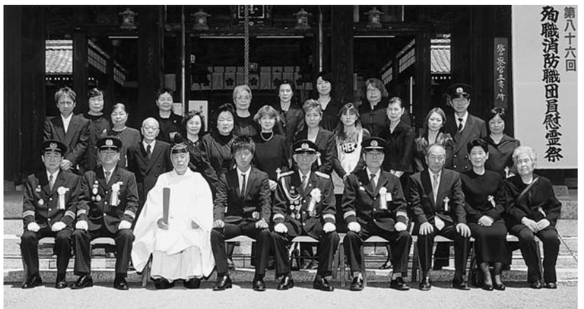
第86回 殉職消防職団員慰霊祭 平成23年5月25日

式後、ご遺族及び主催者は記念写真に納まり、境内の「みゆき会館」に於いて遺族会があり、幸田遺族会会長から全国消防殉職者慰霊祭への参列