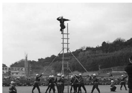
八幡浜市 梯子操法