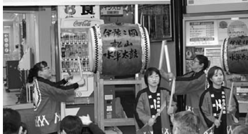
開所式での水軍太鼓披露

大内中学校長が「教育訓練は、皆さんの消防人生の礎になることを胆に命じて、これまでの生活環境から脱皮し気持ち