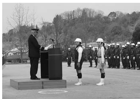
砥部町 団体表彰 広田小学校少年消防クラブ

を続けた被災地消防団員の声を耳にした私は、知識や経験はもとより、消防団員としての強い気持ちはまだまだ足りないと感じました。 昨年夏の松山市総合防災訓練で、視覚障がい者の避難誘導をしていた私は、壁をつたって必死に逃げようとしている人の姿を見つめました。「もう大丈夫ですよ！一緒に行きましょう！」考えるより先に、その手を取り、声をかけていました。「ありがとう」振り向くと、その表情は緊張から安心へと変わっていました。「私は確信したのです。これが消防団の役割なんだ。」と。 私はもうすぐ大学、そして防災サポーターを卒業しますが、消防団は卒業しません。これからは、女性消防団員として、母と一緒に、この街を守っていきます。 私を成長させてくれて、ありがとう消防団！そしてこれからも、がんばろう消防団！