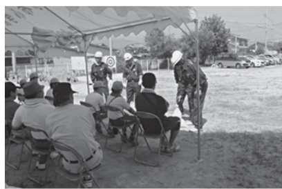
地域での防災訓練指導の様子