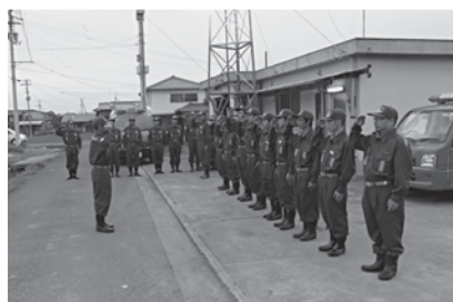
副団長による各分団の機械器具点検実施状況の巡視

愛媛県が発表した南海トラフ巨大地震の被害想定において、西条市は、甚大な被害がもたらされるとの報告がなされました。高い確率で発生が見込まれ、一度発生すれば大規模な災害をもたらす、この地震に、団員として対峙することができているのか、正直不安を感じているところもあります。