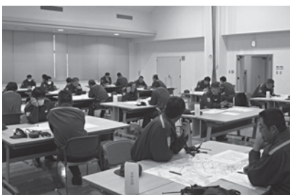
大規模災害を想定しての机上訓練

平成十六年十一月一日に、西条市、東予市、丹原町、小松町が合併し、新たな西条市消防団が発足しては、十二年目を迎えました。私も本年四月より副団長を拝命し、諸先輩方が築いてきた伝統ある西条市消防団を、これまで以上に活性化すべく、若さを武器に日々邁進しているところであります。