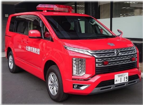
消防団活動車 大洲市消防団