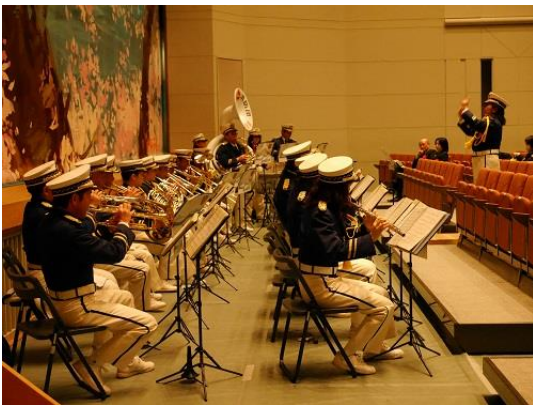
【ウェルカムコンサート】