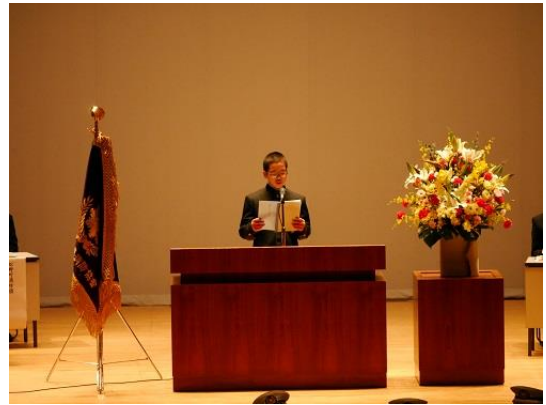
【防火防災に関する作文発表】