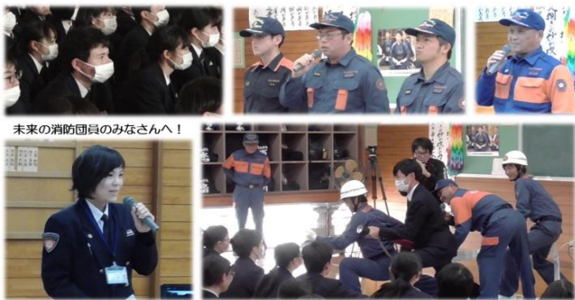
未来の消防団員のみなさんへ!