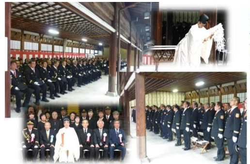
第九十二回 消防殉職団員慰霊祭 2017.5.24