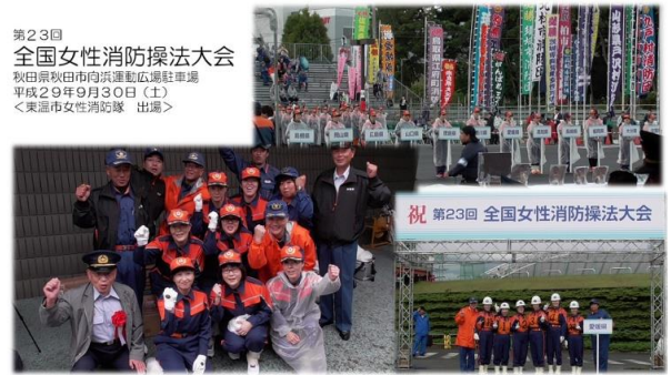
第23回 全国女性消防操法大会 秋田県秋田市向浜運動公園駐車場 平成29年9月30日(土) <東浜市女性消防隊 出場>