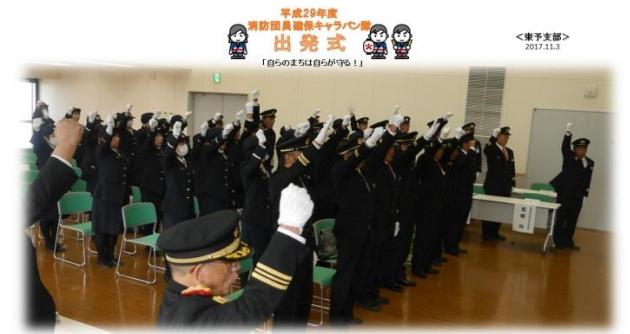
平成29年度 消防団員離任キャラバン隊 出発式 「自らのまちは自らが守る！」 <東予支部> 2017.11.3