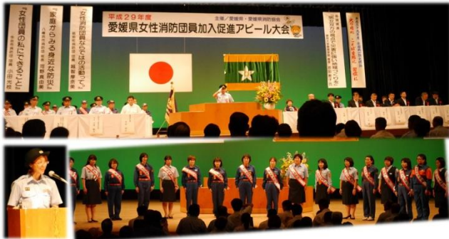
平成29年度 愛媛県女性消防団員加入促進アピール大会