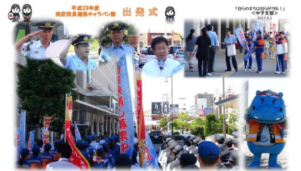
平成29年度 消防団員離任キャラバン隊 出発式 「自らのまちは自らが守る！」 <中予支部> 2017.5.2