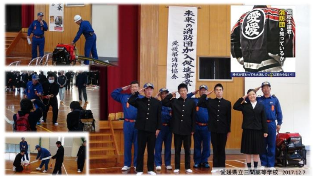
消防団員は君の入団を待ってるんよ!! 未来の消防団員募集中!! 愛媛県立三間高等学校 2017.12.7