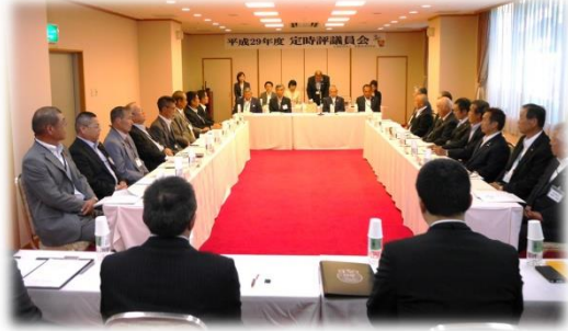
平成29年度公益財団法人愛媛県消防協会 定時評議員会 2017.5.19