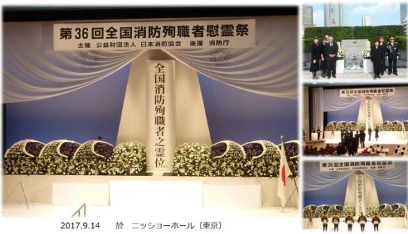
2017.9.14 於 ニッショーホール(東京)