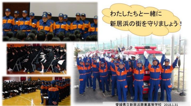
わたしたちと一緒に 新居浜の街を守りましょう!